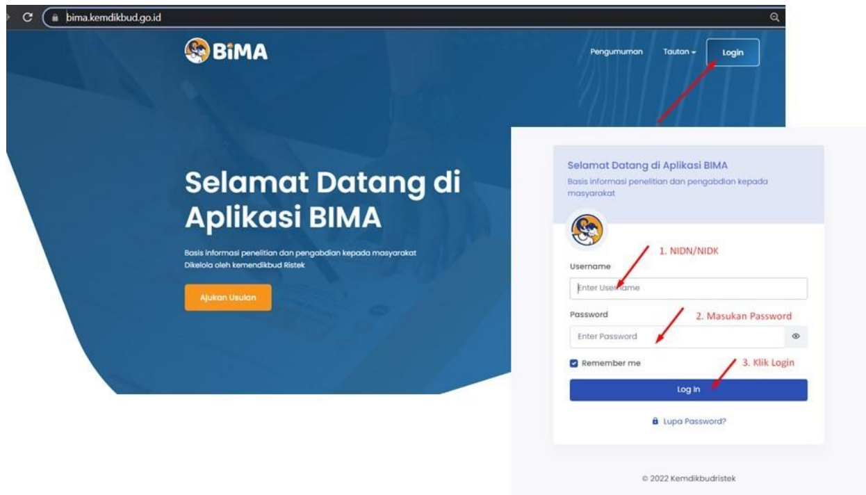
Gambar 1. Beranda akses memasuki aplikasi BIMA

Penerima pendanaan penelitian dan pengabdian kepada masyarakat di Perguruan Tinggi Akademik Tahun Anggaran 2023, wajib melakukan revisi proposal, rencana anggaran biaya (RAB), dan mengunggah surat pernyataan kesanggupan melalui aplikasi BIMA pada laman http://bima.kemdikbud.go.id/ dengan menggunakan akun ketua pengusul masing-masing, sebagaimana diperlihatkan pada Gambar 1.